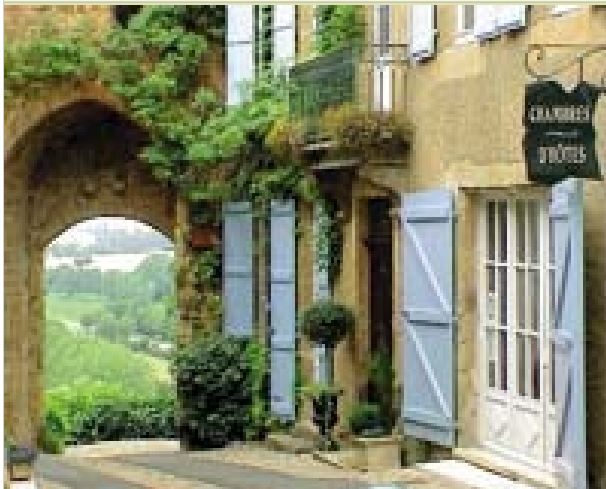
Au village Maison de la porte fortifiée 32320 MONTESQUIOU