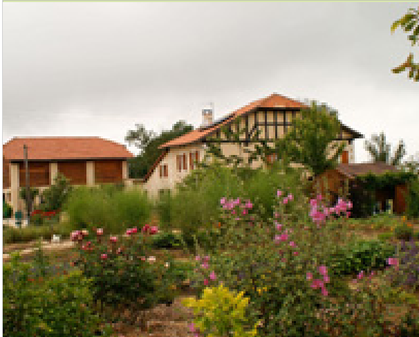
Au Pichet 32120 SAINT-ORENS