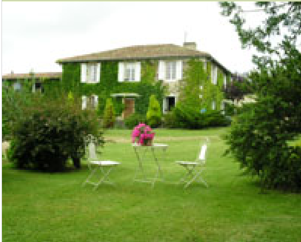
La Haillette 32300 MIRAMONT-D'ASTARAC