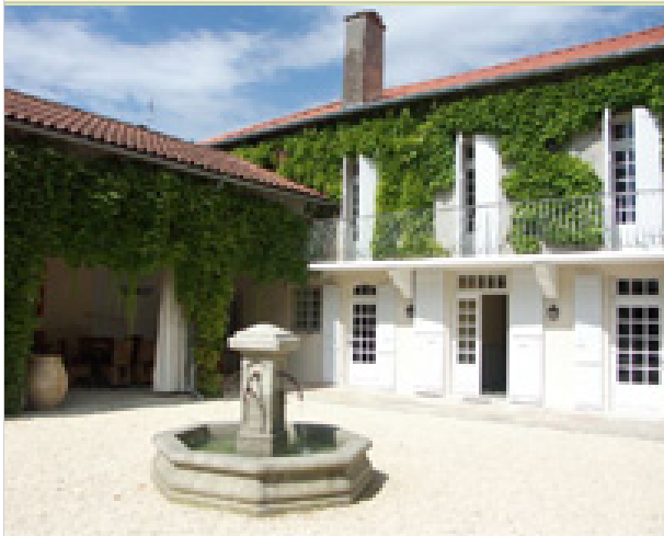
La Baguenaude 9, rue de Juillac 32230 MARCIAC