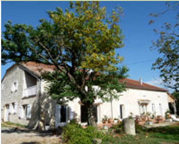
Villeneuve 32340 SAINT-ANTOINE