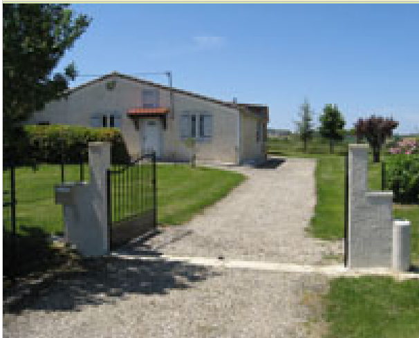
Manoton 32190 CAZAUX-D'ANGLÈS