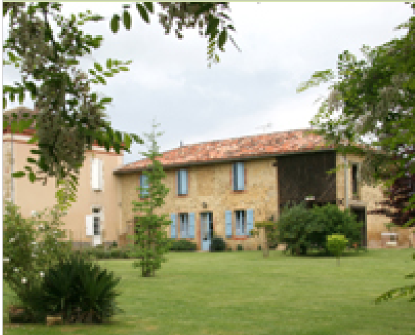
La Carrère 32140 ARROUÈDE