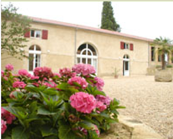
L'Orangerie 32300 MIRAMONT-D'ASTARAC