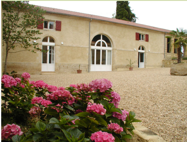
L'Orangerie 32300 MIRAMONT-D'ASTARAC