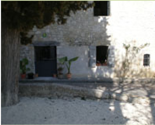
La demeure Saint-Clar 6, rue Gambetta 32380 SAINT-CLAR